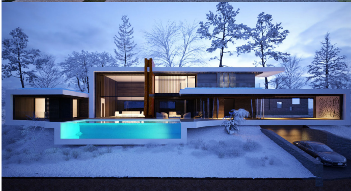
B U D A P E S T magán villaépület 550 m 2 Széchenyi hegy