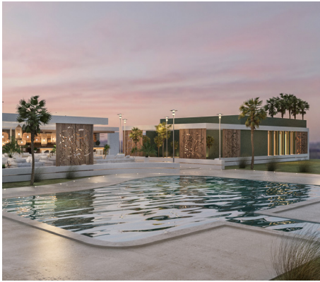
projekt HOTEL EUTÓPA FIT BŐVÍTÉS hely Hévíz