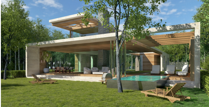
Ö R D Ö G Á R O K magán villaépület 650 m 2 Budapest