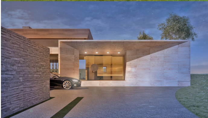
K A P O S V Á R magán villaépület 650 m 2 Kaposvár