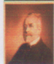
Fellner Sándor (1857-1945)

4.Előadás címe: Fellner Sándor építész életműve.