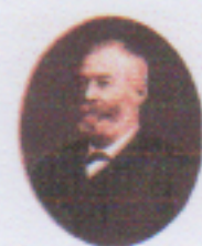
Gregersen Guilbrand (1824 – 1910)

3.Előadás címe: Gregersen Gudbrand építész élete és munkássága.